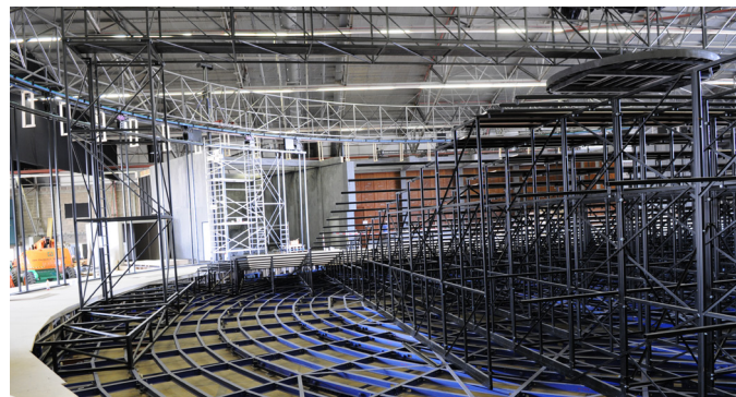
Blik op een deel van het podium. Boven is blauwe stroomrail (Stemann) te zien

Om nu de verschillende decors die op een bepaald moment niet in gebruik zijn aan het zicht te onttrekken, zijn er 4 verplaatsbare schermwanden: 2 st. van 26 x 6 meter en 2 stuks van 9 x 6 meter.