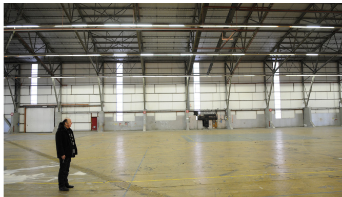
Deel van de hal waar de musical zich afspeelt